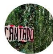
Sigüeiro - Santiago de Compostela