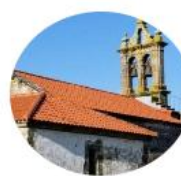
Mesón do Vento/Hospital de Bruma - Sigüeiro