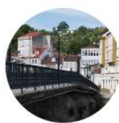
Betanzos - Mesón do Vento / Hospital de