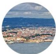
Ferrol - Pontedeume