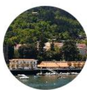
Pontedeume - Betanzos