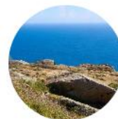
Cee - Finisterre