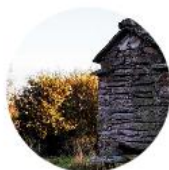
Negreira - Olveiroa