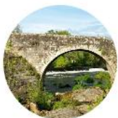
Santiago de Compostela - Negreira