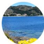
Olveiroa - Cee