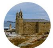
Finisterre - Muxía